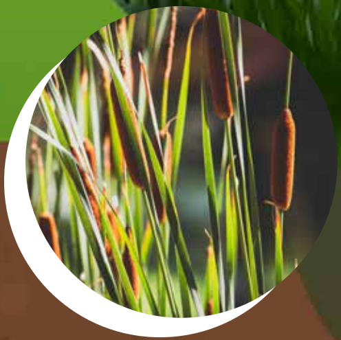
QUENOUILLE À FEUILLE LARGE Typha latifolia