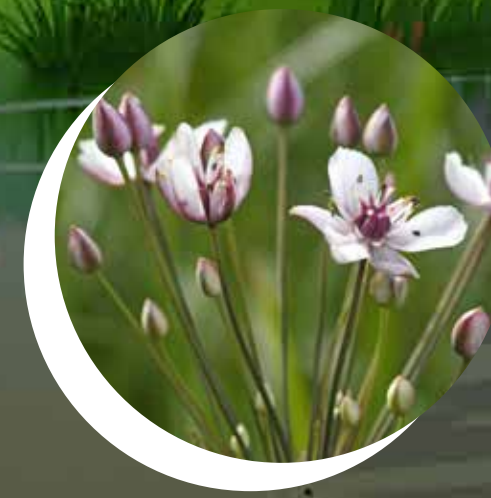
BUTOME À OMBELLE Butomus umbellatus