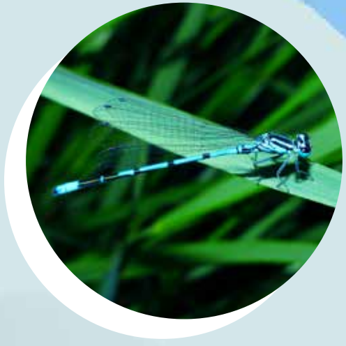
LES DEMOISELLES Zygoptera