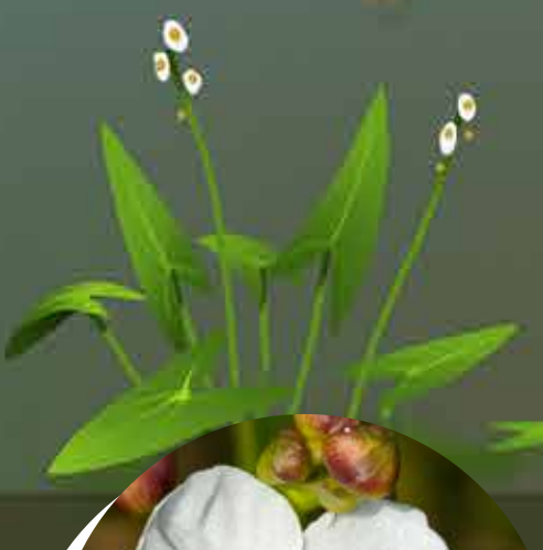
SAGITTAIRE À FEUILLE EN FLÈCHE Sagittaria sagittifolia