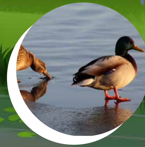
CANARD COLVERT Anas platyrhynchos