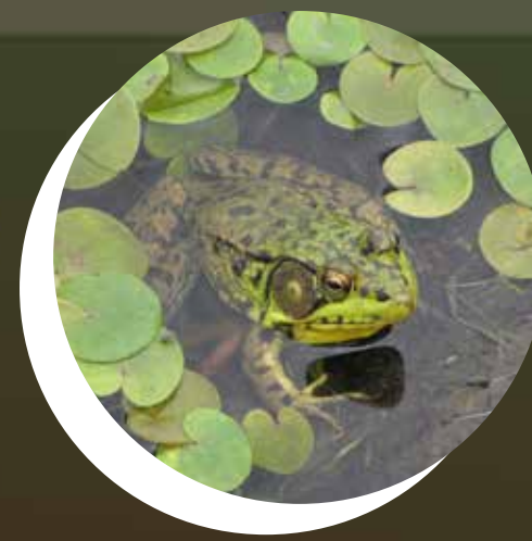
GRENOUILLE VERTE Lithobates clamitans