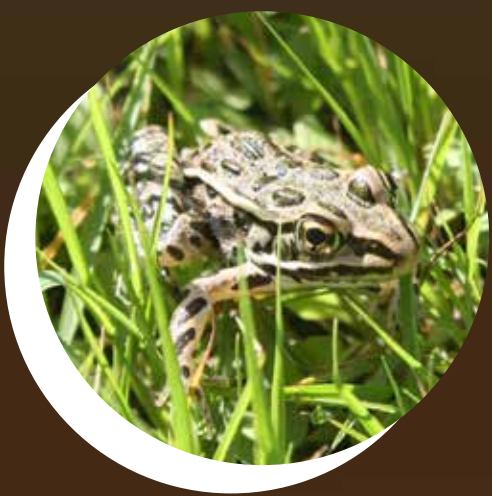
GRENOUILLE LÉOPARD Lithobates pipiens