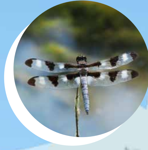
LES LIBELLULES Odonata