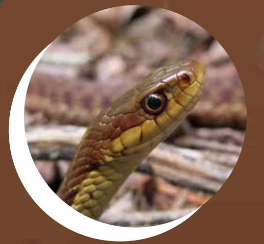
COULEUVRE RAYÉE Thamnophis sirtalis

Le petit étang que tu vois est un écosystème complet, c'est-à-dire un minuscule monde très utile pour beaucoup de petits êtres vivants. Comme dans certaines maisons, il y a plusieurs étages où l'on peut y vivre. À chaque étage se trouve un écosystème différent :