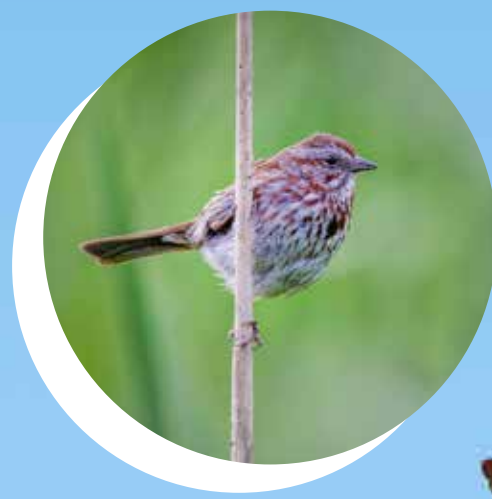
BRUANT CHANTEUR Melospiza melodia